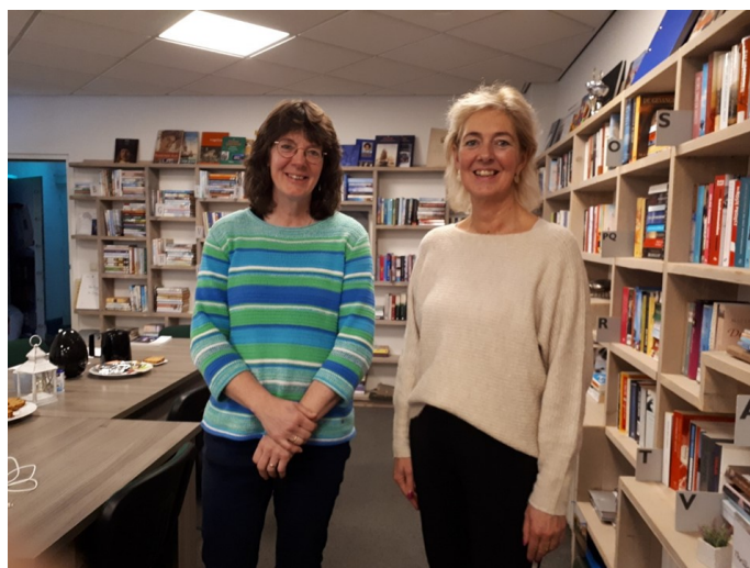
De oude en nieuwe Dorpsondersteuner